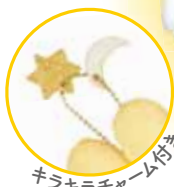
キラキラチャーム付き